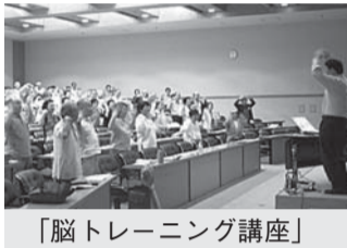
「脳トレーニング講座」

60歳以上の区民を対象にした、出会いと学びの場として、第49回目となる福寿大学を9月3日に開講します。約2ヶ月間で10回の講座。受講生からは「とても充実した内容で楽しく受講できた。」と毎年、好評を得ています。是非ご参加ください。8月1日の広報えどがわで募集記事掲載予定です。