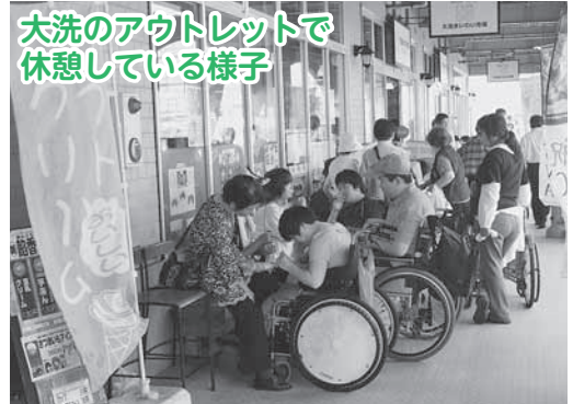
大洗のアウトレットで休憩している様子