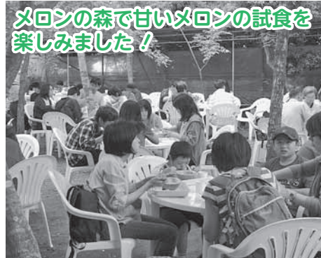
メロンの森で甘いメロンの試食を楽しみました!

今まで一度も参加した事なく、今回も本人に行く気がなかったが、大勢の仲間が誘われて行くことに決まりました。バスハイクに参加して頂きたいと言われ、初参加で出かける機会がなかったので、連中色々話をしたり、我が子の色々な表情に成長を感じることができました。とても楽しく過ごせました。ありがとうございました。