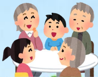
認知症に関する講座や相談