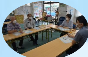
あなたを一冊のノートにまとめます。